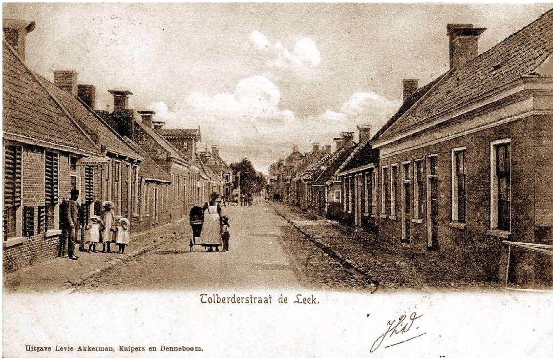
De 'Tolberderstraat' omstreeks 1900.

herdenking van Groningens Ontzet op 28 augustus. Daar waren ook altijd paardenkeuringen aan verbonden: