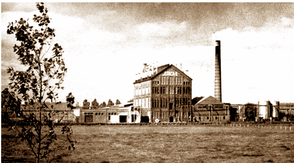
De Erica II aan de Munnikevaart vlak voor de sloop in 1978.

Uit Diepstra, J., Boeren numen 't buukspreken. Oostwold rond 1800 , Leek, z.j. (omstreeks 1990).