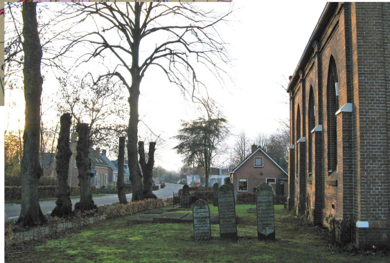
Oostwold op een topografische kaart uit 1905. De Hoofdstraat richting Lettelbert gefotografeerd (november 2010).

Het dorp is gebouwd op de zuidelijkste van vier vrij vlakke zandruggen, die nagenoeg parallel aan elkaar in zuidwestelijke richting lopen. De andere dorpen en gehuchten die op dezelfde zandrug liggen zijn: Lettelbert,