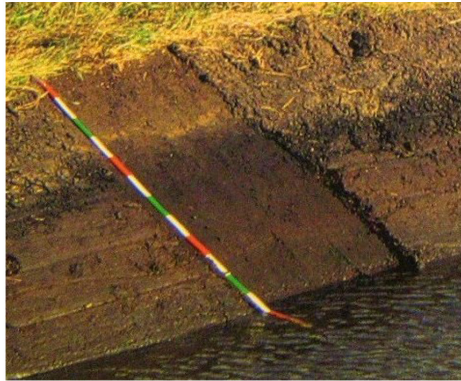
De Matsloot ten oosten van het Leekstermeer (foto en kadertekst Gerrie Koopman, Noorderbreedte, jaargang 27, nummer 1, januari-februari 2003).

zuurstofarme water op en vormden een dikke laag veen. Het veenpakket in het Leekstermeergebied is gemiddeld vier meter dik en werd gevormd onder relatief voedselrijke omstandigheden. Het bevat daarom veel herkenbare resten van rietplanten. Door de steeds verder stijgende zeespiegel drong de zee het veenlandschap binnen en overstromde rond 500 na Chr. ook delen van het Leekstermeergebied. Over het veen werd een pakket zeeklei afgezet.” (...) “De laag zeeklei wordt naar het noorden toe steeds dikker.” (...) “De foto van de pas aangesneden slootkant is genomen in noordoostelijke richting (oktober 2002). Linksboven zien we de bomen langs de A7 en op de achtergrond de CSM-suikerbietenfabriek Vierverlaten in Hoogkerk.” (zie pijl). Ten aanzien van de gronden rond Oostwold is deze beschrijving grotendeels van toepassing. Zoals hiervoor reeds is beschreven, variëren de kleidekken in dikte.