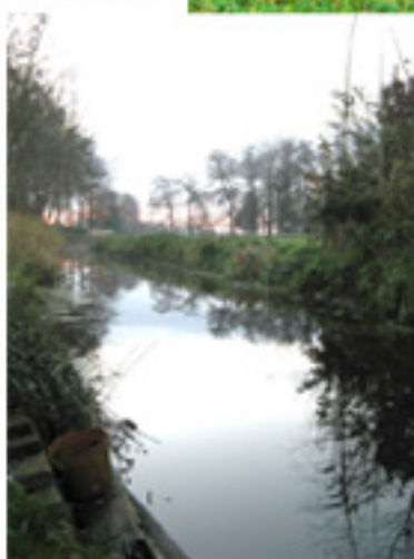
De Gave in het dorpscentrum. Op de foto omstreeks 1920 (links-boven), de hoek Hoofdstraat – Kerkeweg, onder andere de brughekjes aan weerszijden van de weg. Op de foto's uit 2010 dezelfde duiker en De Gave aan weerszijden ervan: foto rechts is in westelijke richting genomen; foto links naar het oosten.

Oostwold was in vroeger tijd vaak moeilijk te bereiken, vanwege het feit dat er geen behoorlijke wegen waren. Een modderpad liep van Oostwold in westelijke richting naar Lettelbert en Midwolde, en in oostelijke richting naar de Poffert en Lutje Oostwold. Een zandpad liep vanaf de kerk in noordelijke richting naar de Oostwolderme Klappe en de daaraan gelegen trekweg langs het Hoendiep. Ook deze paden stonden vaak onder water.