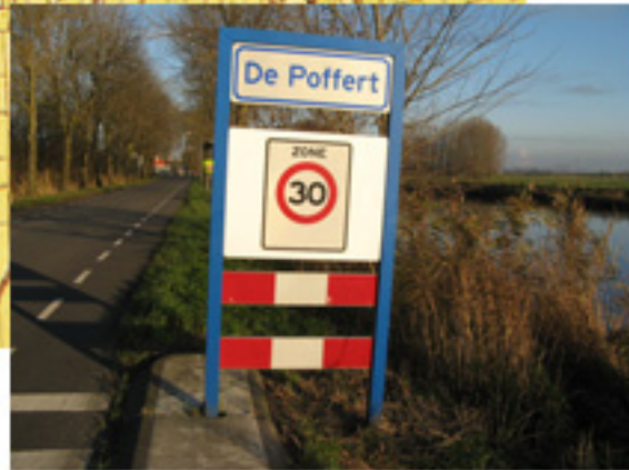
Op de topografische kaart van 1851-1855 is de kunstweg nog niet aanwezig. De foto uit 2010 toont de weg tussen Oostwold en De Poffert.

Veel scheepvaartverkeer richting Leek en Friesland kwam dus door Oostwold. Toen het Hoendiep in 1616 vanaf de Poffert tot aan Enumatil werd gegraven, heeft de Gave als doorgaande route voor de scheepvaart sterk aan belangrijkheid ingeboet.