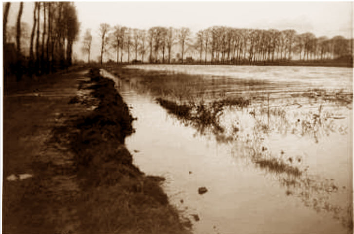
Wateroverlast aan de Munnikevaart in 1961. Dit kwam bijna elke winter voor wanneer overtollig water uit Noord-Drenthe via het Leekstermeer de Munnikevaart in stroomde, op weg naar het gemaal 'Electra' bij Oldenhove.

Euwenlang hebben de Oostwolmers, zoals de bewoners van Oostwold genoemd worden, te kampen gehad met wateroverlast. Vaak